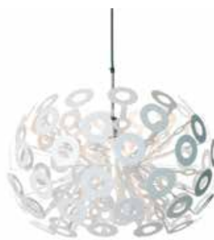
9. MOOOI DANDELON

Piękna w swej formie wisząca lampa z dmuchanego w charakterystyczny kształt szkła. Zaprojektowana dla Fontana Arte w 2003 roku przez duet designerów z Barcelony Harry'ego and Camillę. Przezroczysto żółtawe opalizujące szkło podtrzymuje kabel w kolorze... niebieskim