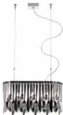
5. FABBIAN Hungry Pendant

Lampa – żart kuchenny, ze słowem „głodny” w nazwie, dlatego dedykowana przede wszystkim do oryginalnych kuchni i jadalni. Na stalowej konstrukcji z polerowanym chromem wisi seria sztućców ze stali nierdzewnej.