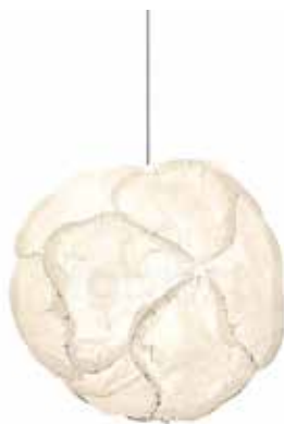
2. BELUX CLOUD

Wprowadzająca spokój i pozytywne emocje – dlatego idealna do pokoju dziecka, ale nie tylko. Hiszpański producent Estiluz oferuje taką niesamowitą lampę wykonaną z satynowanego polietylenu z... wiszącym cienkim kablem-sznureczkiem służącym za włącznik. Balloon występuje również w wersji przyściennej.