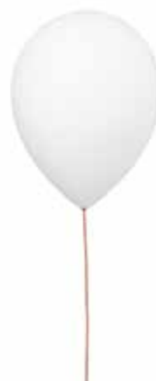
3. BALLOON by Estiluz

Zjawiskowa oprawa zaprojektowana została przez polską projektantkę Darię Burlioską. W 2009 roku Instytut Wzornictwa Przemysłowego docenił projekt, który został zakwalifikowany do finału konkursu Dobry Wzór 2009. Klosz wykonano z pianki polietylenowej, tworzywa akrylowego, mocowana jest na linie stalowej, a źródło światła to energooszczędna świetlówka.